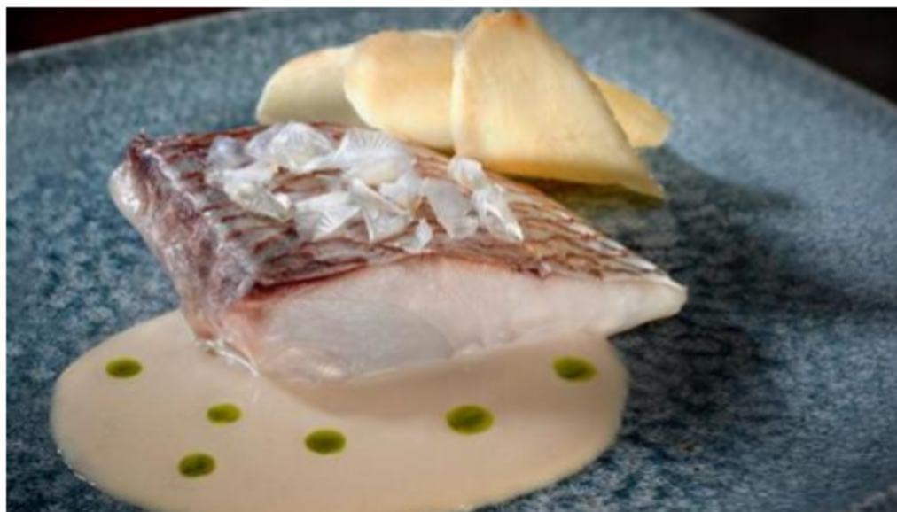
Plato de BB Bistró, en Madrid